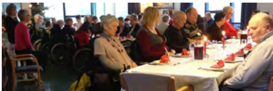
Jól í MS Setrinu.