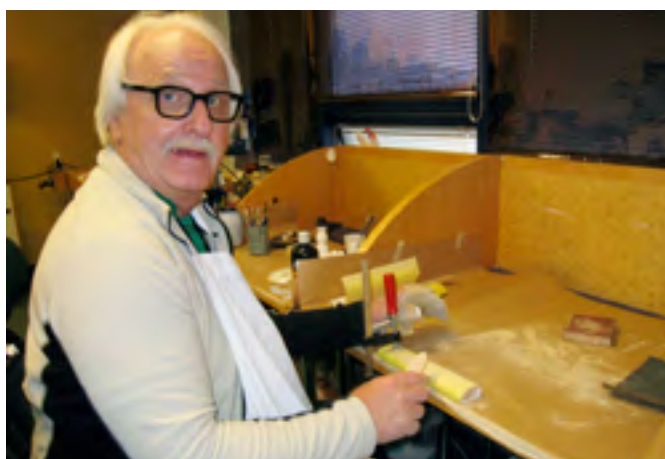
Smjörhnífar pússaðir. Haukur Gröndal.