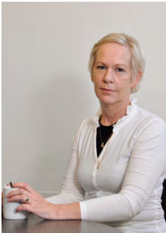
Hera: „Ég er að læra að sleppa hendinni af dóttur minni en vera bara til staðar ef á þarf að halda.“

Mikið hefði ég viljað að einhver hefði haft samband við mig og boðið mér í spjall, þá helst einhvern með reynslu af MS og líka hefði verið gott að fá stuðning frá öðrum foreldrum. Því að maður verður líka að passa sig að missa sig ekki í meðaumkun með barninu og læra að greina á milli tilfinninga.