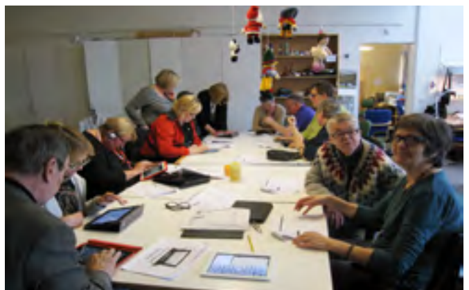
Ipad-kennsla á vegum Tölvumiðstöðvar fatlaðra.