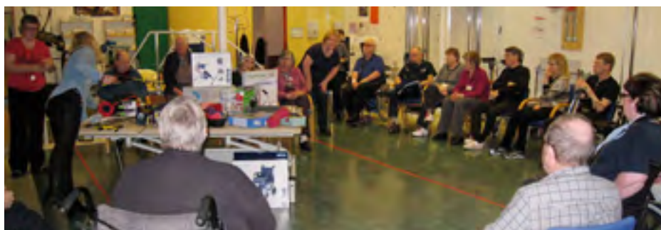
Kynning á hjálpartækjum.