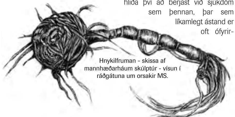
Hnykilfruman - skissa af mannhæðarháum skúlptúr - vísun í ráðgátuna um orsakir MS.