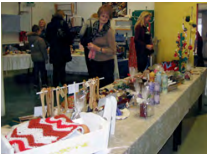
Margir fallegir munir voru til sölu á hinum árlega jólabasar.