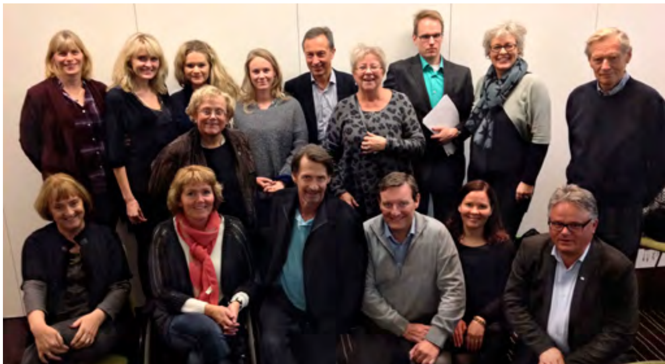
Þátttakendur í haustfundi NMSR 2013 á Íslandi.