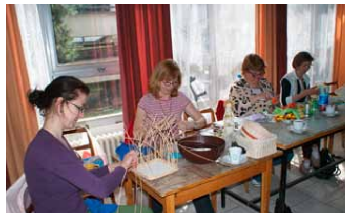
Frá handverksleikum SZSM 2010.

Á árinu 2009 var MS-ingum frá nágrannabjóðunum Tékklandi, Póllandi og Ungverjalandi boðið að taka þátt og á næsta ári er MS-fólki hvaðanæva að boðið til þátttöku, þar á meðal frá Íslandi. Keppnin verður haldin helgina 24.-27. júní næstkomandi og býður slóvaska félagið upp á gistingu og mat meðan á leikunum stendur. Hins vegar þurfa þátttakendur að koma sér sjálfir til Košice í Slóvakíu. Þeir sem kunna að hafa áhuga á að taka þátt í slóvesku Abiolympics handverks-