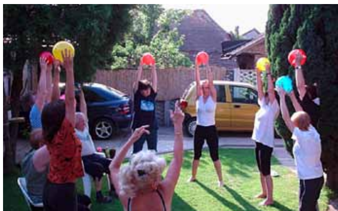
Útileikfimi í Slóvakíu.

Í Slóvakíu eru um 10.000 manns greindir með MS. Slóvaska MS-félagið, SZSM, var stofnað í apríl 1990 og hélt því upp á 20 ára afmæli sitt síðastliðið vor. Félagið vinnur að sömu markmiðum og MS-félag Íslands, það er að betri lífsgæðum fyrir MS-fólk og aðstandendur þeirra. Undir SZSM eru 33 deildir sem staðsettar eru víðs vegar um landið með rúmlega 1.300 félagsmenn.