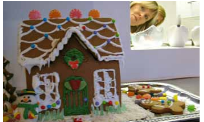
Jólatréð í stofu stendur... Spennungurinn leynir sér ekki í andliti þessara tveggja.