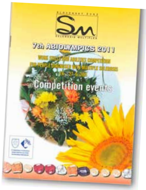
Kynningarbæklingur handverksleikanna í júní 2011

leikunum eru beðnir um að hafa samband við mig hjá MS-félaginu.