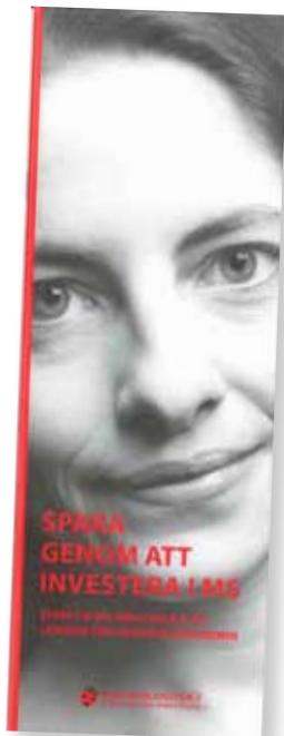
Bæklingur sænska félagsins um könnun á atvinnuþátttöku

Sænska rannsóknin gekk út á það að bera saman hæfni fólks til vinnu fyrir og eftir árs meðhöndlun með