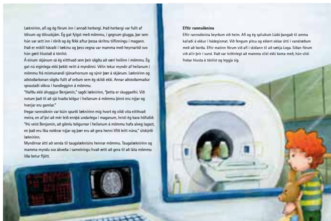
Opna úr bókinni.

Um það bil 430 manns á Íslandi eru með MS – það er um 1,4 af hverjum 1000. Í dag er hægt að meðhöndla MS á virkan hátt með bæði lyfjum og sjúkrahjálfun og sjúkdómurinn þarf ekki sjálfkrafa að hafa það í för með sér að fólk þurfi að nota hjólastól.