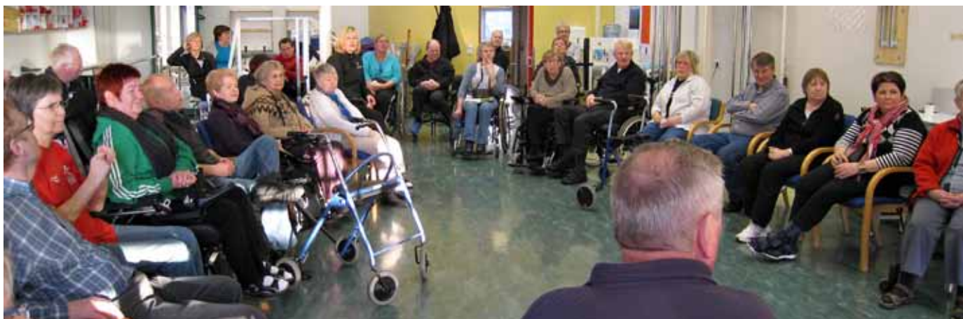
Frá fyrirlestri í heilsuviku sem er orðin fastur viðburður á Setrinu tvisvar á ári.