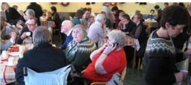
Opið hús – handverkssala – súkkulaði og rjóma-vöflur.