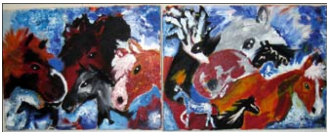
Þetta listaverk heitir Sálarbræður, sálarsystur