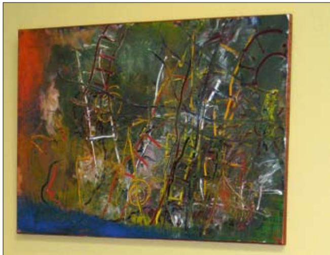
Myndin Stiklur prýðir nú veggj Endurhæfingamiðstöðvarinnar

Síðustu mánuði hefur verið starfræktur myndlistarhópur og mun afrakstur hópsins prýða listavegginn okkar í sumar.