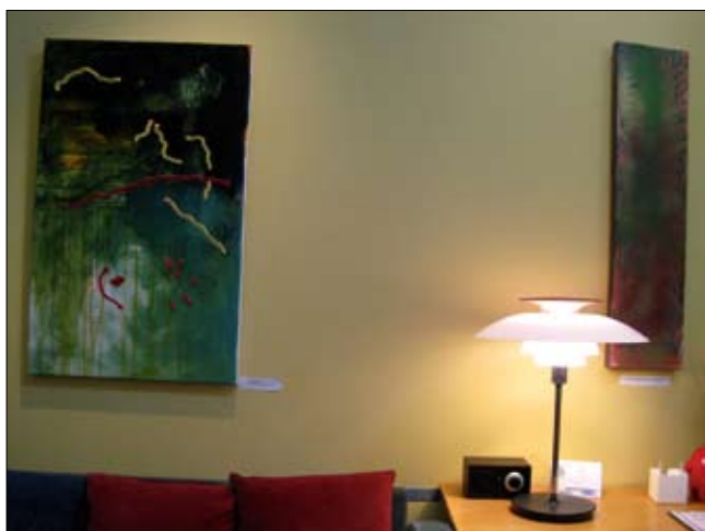
Myndirnar Leiðarljós og Pálmi undir blóðrauðum urðarmána