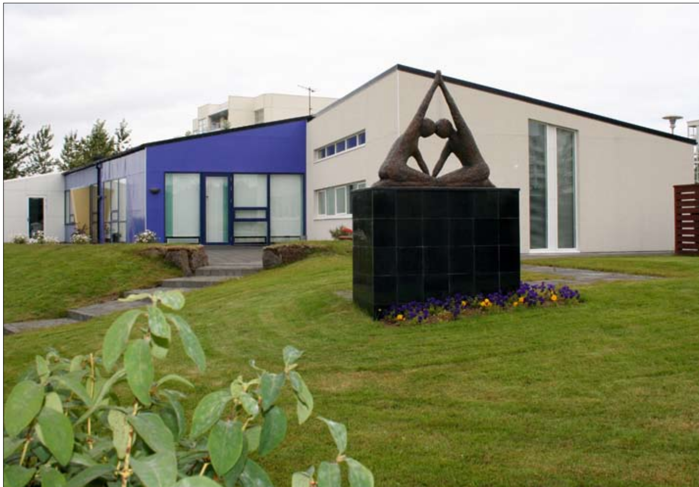
Hús MS-félags Íslands að Sléttuvegi 5, Reykjavík.

fulla vinnu aftur, annar að hann geti nú nánast allt eins og heilbrigð manneskja og tveir orðuðu það einfaldlega svo að líf þeirra hefði hafist að nýju þegar þeir hófu meðferð með Tysabri.